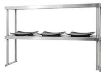
DOUBLE OVERSHELF WITH ADJUSTABLE MIDDLE SHELF

Double overshelf can be used with all prep tables Product code: TDO5-XX-SS